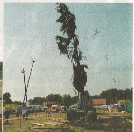
▲ Imposant: Den Besuchern wurde in Groß Heins auch teure und große Forst-High-Tech vorgeführt.